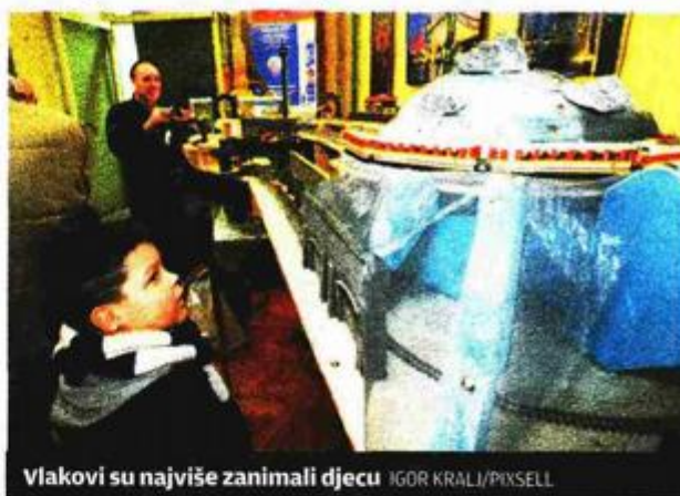
Vlakovi su najviše zanimali djecu